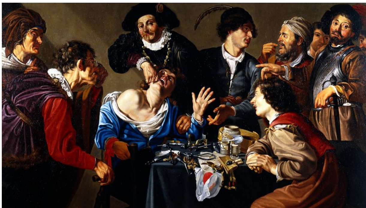
Theodor Rombouts, Wyrywacz zębów (1635) – Madryt, Muzeum Prado.