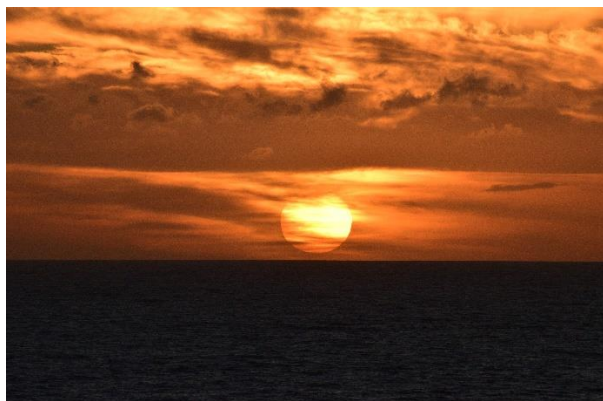
Gdzieś na morzu.