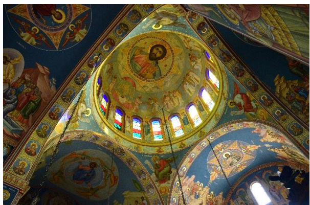
Cypr – świątynia w Limassol.