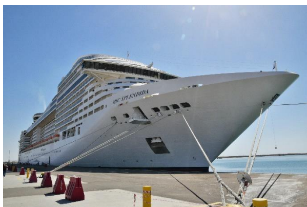
Statek MSC Splendida.