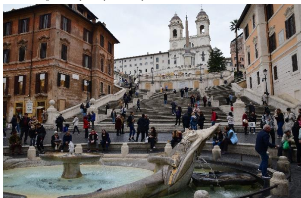
Rzym – Schody Hiszpańskie.