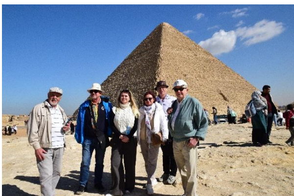
Część naszej grupy przed Wielką Piramidą Cheopsa.