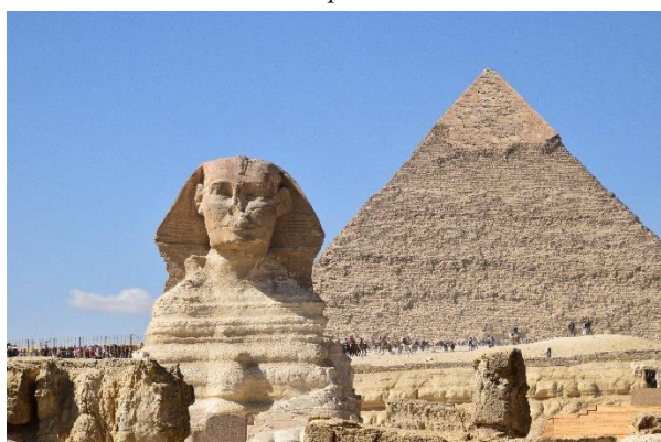
Sfinks i piramida Chefrena.