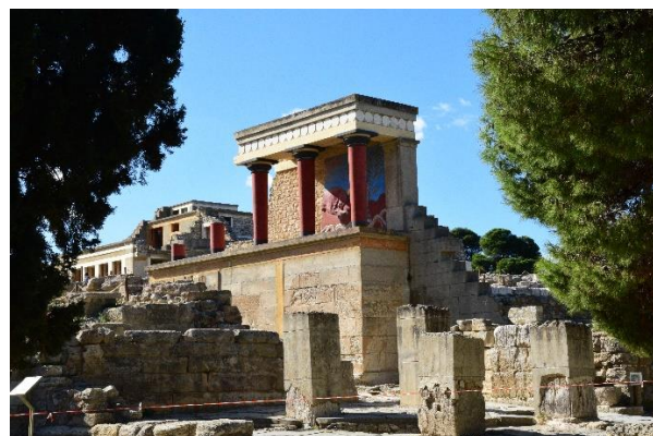
Ruiny pałacu w Knossos.